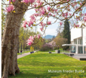
Museum Frieder Burda